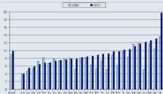
PART D'ENFANTS ET ADULTES VIVANT DANS DES MÉNAGES SANS EMPLOI (2008 ET 2010)

rieuse. La récession a renforcé l'écart en termes d'emploi avec les travailleurs locaux. En 2011, environ 20% des travailleurs migrants était sans travail, ce taux dépasse 30% pour les jeunes migrants . Le secteur de la construction a été le plus touché par cette perte d'emploi. Une dernière donnée très parlante concerne le taux de chômage des personnes les moins qualifiées qui est passé de moins de 9% en 2008 à environ 15% en 2011. Le fait d'être moins qualifié augmente également le risque de pauvreté : en 2010, 40% des personnes les moins qualifiées étaient à risque de pauvreté et d'exclusion sociale , avec une hausse de 1,6 point par rapport à l'année précédente.