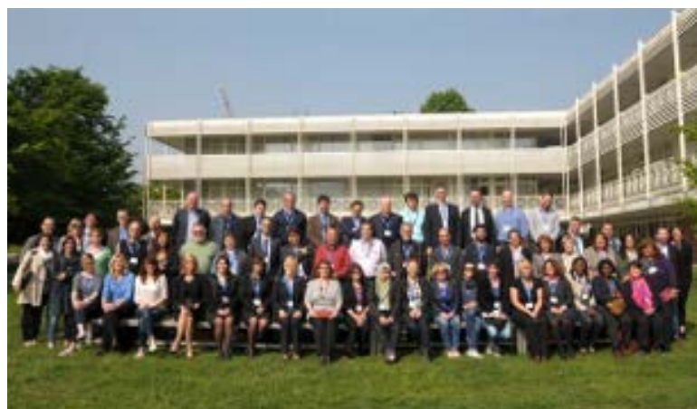
A4I-CES conférence de networking building

L'ensemble des affiliés de la CES ont été associés à la mise en place de UnionMigrantNet depuis décembre 2013. Lors de la Première conférence européenne sur les services syndicaux destinés aux migrants, près de 150 représentants syndicaux se sont fixé pour objectif de rassembler les services syndicaux aux migrants dans un seul réseau paneuropéen.